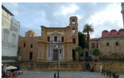
Chiesa S. Maria dell'Ammiraglio o Chiesa della Martorana