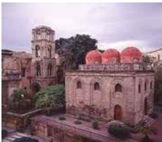
Chiesa di S. Cataldo - Palermo